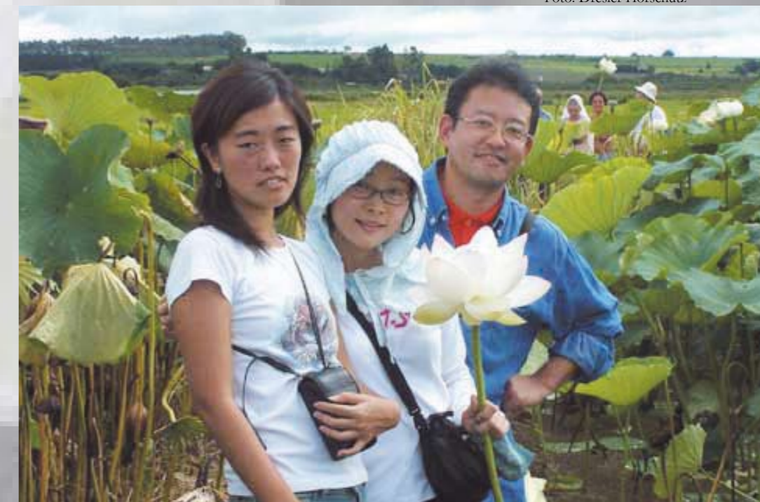
Foto da colheita da raiz de lótus, publicada na edição de maio de 2005, com destaque para a flor que desabrocha apenas uma vez por ano