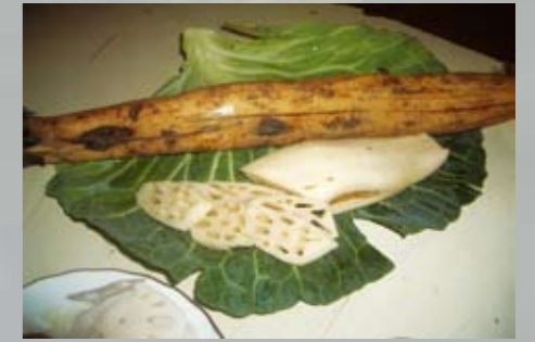
Mombuca: 90% da raiz de lótus do Brasil

Apesar de uma população menor, Mombuca está mais viva do que nunca. A força e a esperança dessa comunidade mantêm as tradições em todos os rituais da cultura japonesa. Sua festa mais famosa, a da colheita, acontece há 45 anos no início de julho, com culinária, danças típicas, exposição e venda de produtos. Em novembro acontece a homenagem