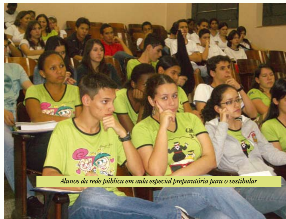
Alunos da rede pública em aula especial preparatória para o vestibular