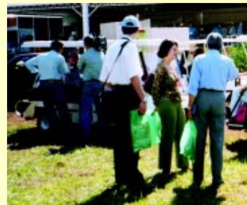
Embaixadores estrangeiros visita

Terça-feira. A agenda da ABAG/RP na Agrishow foi tomada por 160 estudantes e professores. Durante todo o dia o Programa Educacional “Agronegócio na Escola” foi a estrela. Com seus visitantes uniformizados e andando sempre juntos, a atenção se voltou para eles, que se interessavam por tudo: pelas pesquisas desenvolvidas por universidades que estavam expondo na Feira, pelas grandes máquinas autopropelidas, por tratores que quando programados não precisam da ação humana, por estreitas mangueiras de irrigação que não desperdiçam água, pela bicicleta adaptada para