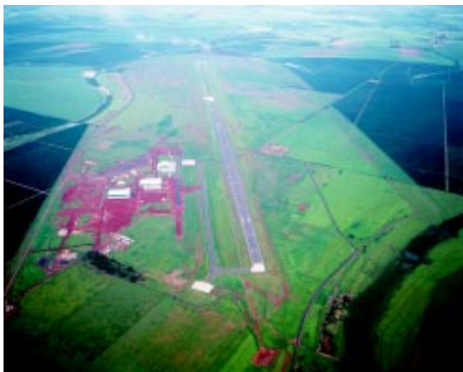
Pista de pouso da Embraer na fábrica de Gavião Peixoto

Café, ferrovia e imigrantes. Assim começou a história do desenvolvimento de Gavião Peixoto. Hoje a cidade tem laranja, cana-de-açúcar, fábrica de aviões e espera pelo novo "boom" de desenvolvimento. A instalação da fábrica, por enquanto, não trouxe mudanças significativas para os rumos da cidade, que sempre teve a agricultura como sua maior fon-