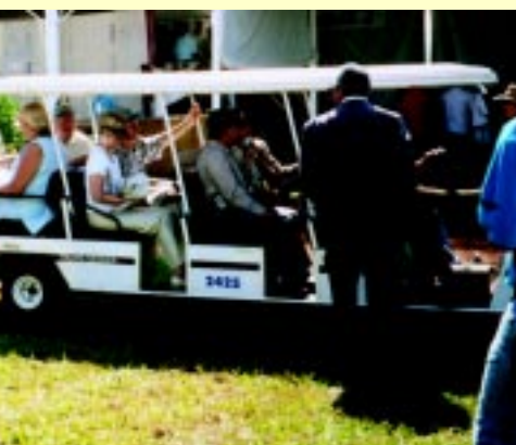
em a Agrishow: estática e dinâmica

Na sexta-feira, o "palco" da Agrishow voltou a ser exclusivo dos verdadeiros atores que fazem dela a Feira de agronegócios mais importante do país: os 610 expositores e produtores de todo o Brasil. Já no sábado, o público que toma conta de suas ruas é formado pela população urbana. Uma curiosidade natural já que durante uma semana não se fala em outra coisa na região. Os jornais não param de publicar notícias sobre este setor que continua, apesar da crise, a carregar o crescimento do país.