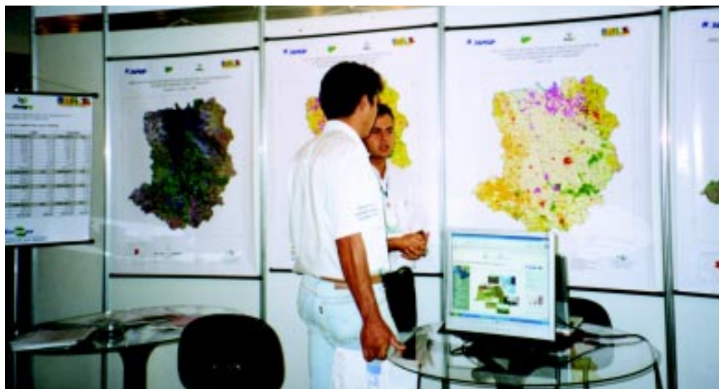
O Sistema de Gestão Territorial da Abag/RP estará a disposição dos interessados no site: www.abagr.org.br

A simulação dos impactos é feita com base em um banco geocodificado de dados agrônômicos, ecológicos, sociais e econômicos, estruturados em um sistema conhecido como WebGIS. Esse eficiente sistema de gestão foi desenhado pensando na possibilidade do seu uso na formulação de políticas voltadas para o desenvolvimento da região, tanto no setor urbano quanto rural,