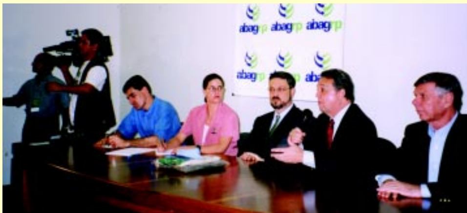
O Ministro da Fazenda não pode comparecer à abertura da Agrishow mas se encontrou com líderes do agronegócio na sede da ABAG/RP

Na segunda-feira, na solenidade de abertura, a grande atração foi o Presidente da Câmara dos Deputados, Severino Cavalcante, que fez um elogio rasgado ao