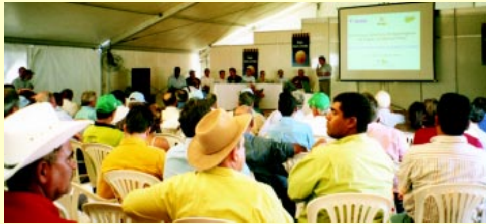
Parlamentares e empresários em reunião na Agrishow em busca do consenso

fazer a pulverização, pela plantadeira que deposita a semente no espaço milimetricamente calculado, pela colheita de milho vista bem de pertinho, pelas informações sobre sanidade animal. Os estudantes deram importância para tudo. O que as vezes é tão óbvio para quem frequenta a Feira, é extremamente interessante para quem está descobrindo a tecnologia aplicada ao agronegócio.