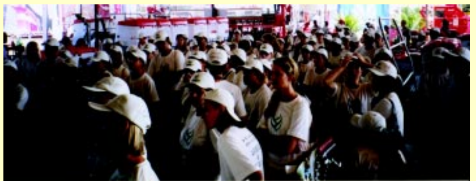
Alunos do "Programa Educacional "Agronegócio na Escola" visitam pelo 5º ano a Agrishow